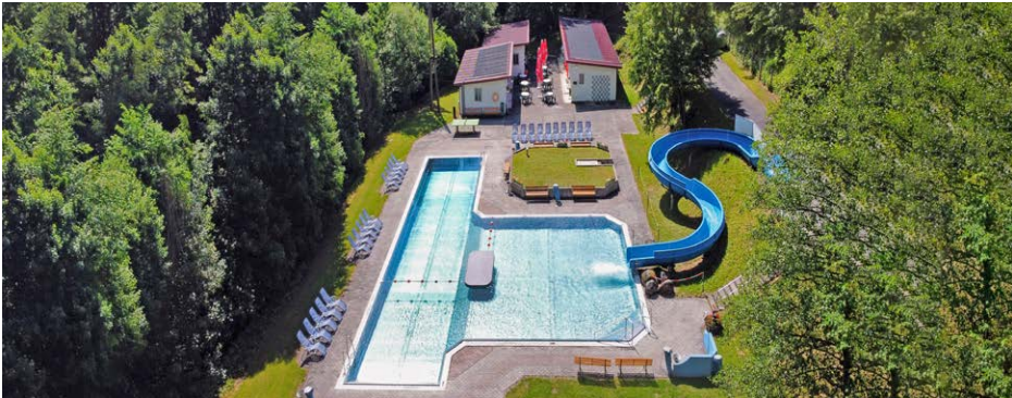
Idyllisch gelegenes Waldbad