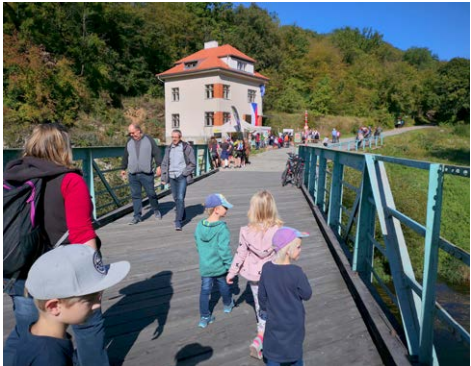
Grenzbrücke nach Tschechien