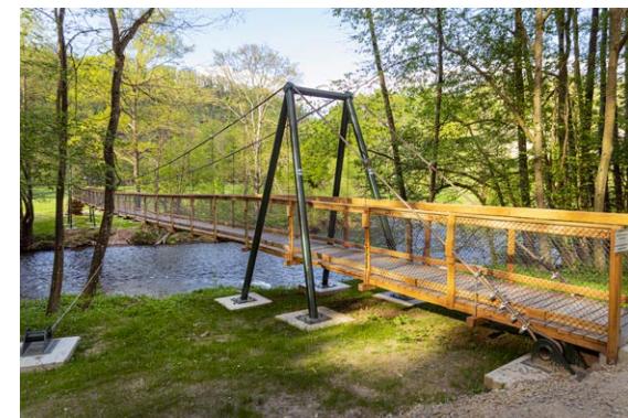
Hängebrücke bei der Einsiedlerwiese