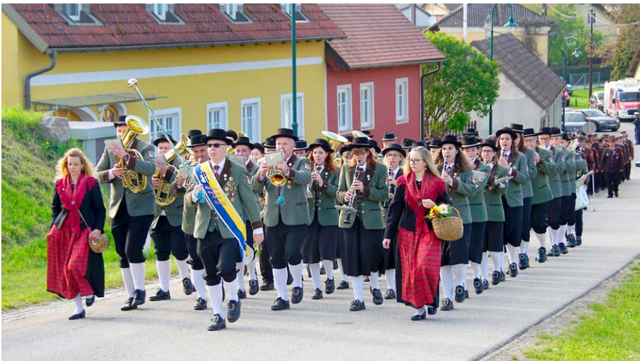
Waldviertler Grenzlandkapelle der Stadtgemeinde Hardegg